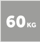
BALLEN- GEWICHT KARTONAGE